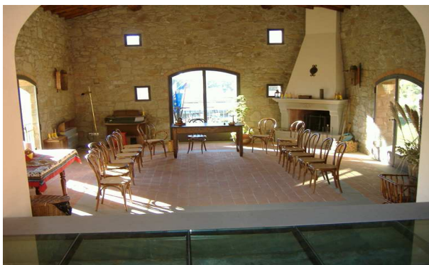
Interno del fienile di Casalbosco: Sala "Giuseppe Chini".

L'idea è di creare un circuito di accoglienza e attività, legate all'agricoltura e alle case-vacanza, che possano mettere in moto le capacità e risvegliare il senso di appartenenza al territorio delle persone con problemi mentali alla cui riabilitazione è rivolta l'esperienza temporanea proposta dalla Fondazione. Un piccolo nucleo di due appartamenti, uno con quattro camere, servizi, parloir, area di servizio e ufficio posto sotto l'abitazione dei Fondatori, l'altro con due camere e servizi sotto il salone polivalente a Casalbosco-Rufina . Entrambi possono rappresentare un'occasione di autonomia abitativa, protetta dalla presenza di un tutor e seguita dal servizio territoriale, in contatto con i curanti psichiatri di provenienza degli utenti e in collaborazione con l'Università di Firenze. Per la formazione degli operatori ci si avvarrà di agenzie accreditate e dell'apporto dell'équipe che partecipa all'esperienza: sarà utile allo scopo un salone polivalente ricavato nell'ex fienile della casa colonica di Casalbosco , adatto anche a seminari e riunioni, già utilizzato per Corsi, seminari, teatro-terapia, gruppi di auto-mutuo-aiuto tra familiari, riunioni conviviali, etc.