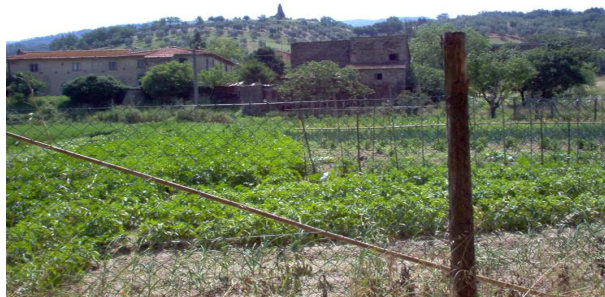
Vista dei campi dell'Azienda Agricola a Scopeti da cui si intravede il borghetto e il vecchio mulino.

divenuto il salone polivalente L'Azienda Agricola Sociale di proprietà del Presidente della Fondazione (12 ha circa), prevalentemente a Scopeti (km 3,5 oltre Rufina) e in piccola parte a Rufina lungo Sieve, oltre ad una abetina (ha 1,3) nel comune di Pratovecchio (AR), saranno messi a disposizione per corsi di istruzione professionale, inserimenti socio-terapeutici e lavorativi nella cooperativa Casalbosco (di tipo "B") che non interesseranno soltanto le persone accolte negli appartamenti di Casalbosco , ma gli utenti che, nel territorio della zona Fiorentina Sud-Est e non solo, si sentiranno di imparare vivaistica, olivicoltura e viticoltura con l'aiuto di un Tutor, del Personale impiegato e di Volontari che hanno esperienza dei lavori di campagna. Nel terreno lungo Sieve, che dà sulla variante della SS 67 a Rufina, è previsto un punto vendita diretta dei prodotti coltivati e una "paninetteria" rustica.