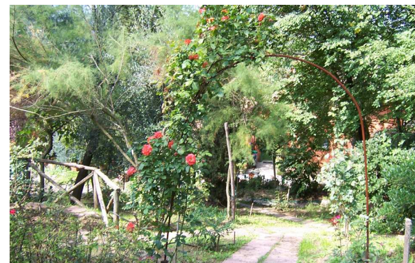
Particolare del giardino a Casalbosco all'uscita dal roseto.